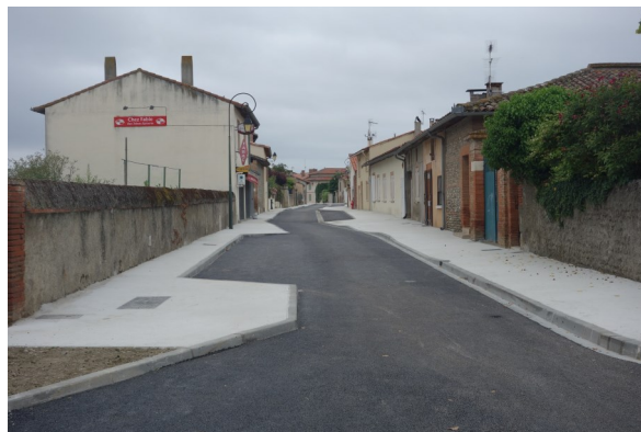
RD 48 E